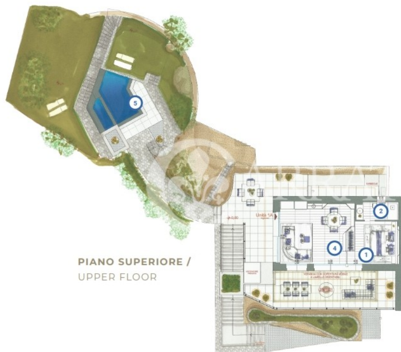
PIANO SUPERIORE / UPPER FLOOR